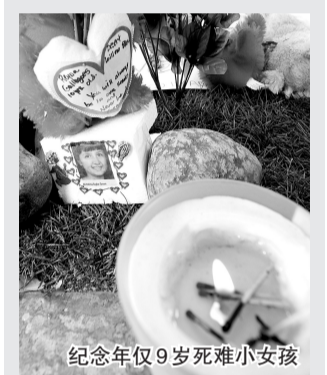
纪念年仅9岁死难小女孩

警方对麦什的英勇行为表示称赞。而麦什将功劳归功于其他和疑犯搏斗的人。她说:“我不是英雄,所有这些关注都让我感到尴尬。”1月11日《新京报》A27 谢来