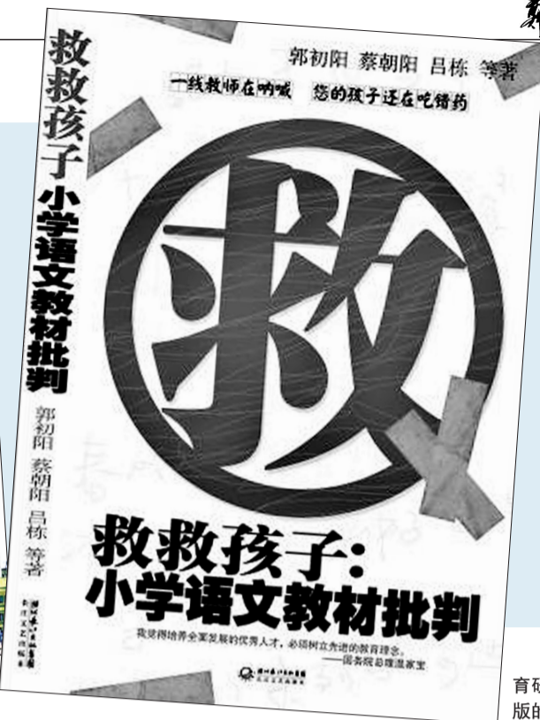
“第一线教育研究小组”出版的书籍