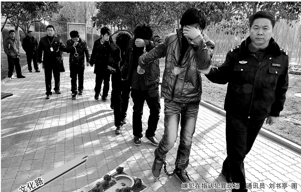
嫌犯在指认犯罪现场