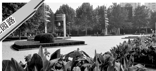
文博广场