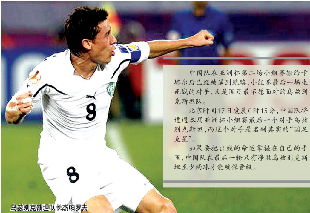
乌兹别克斯坦队长杰帕罗夫