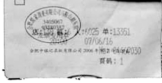
家乐福安徽马鞍山湖东店促销1元/杯乳品仍按1.3元/杯结账。(资料图片)

家乐福要求增加扣点,而且是在后台扣,不是扣在前台,等于两边压我们厂家。”这位负责人表示,在各种原材料上涨的情况下,家乐福如此对待供应商,是很难接受的。