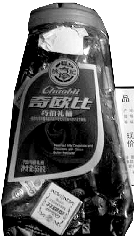
天津家乐福龙城店促销价格39元,原价也是39元。(资料图片)