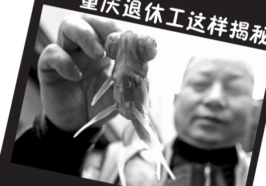
金鱼腹部绑上小铁片