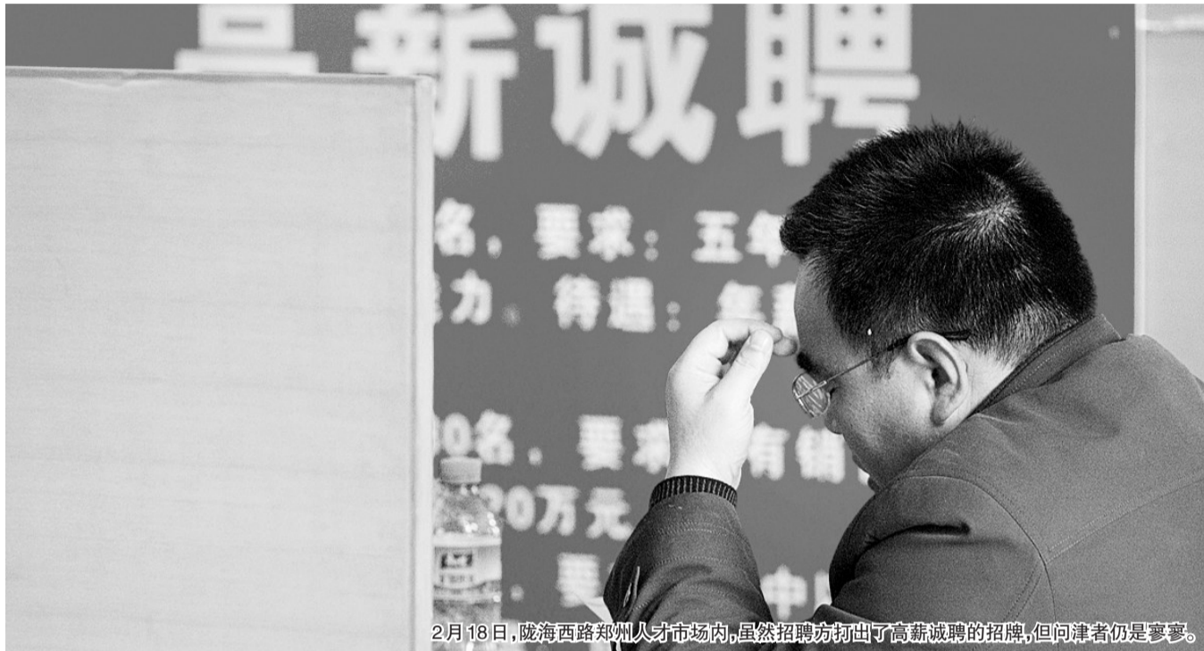
2月18日,陇海西路郑州人才市场内,虽然招聘方打出了高薪诚聘的招牌,但问津者仍是寥寥。