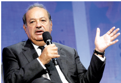
斯利姆手腕上戴的皮带腕表相当普通。