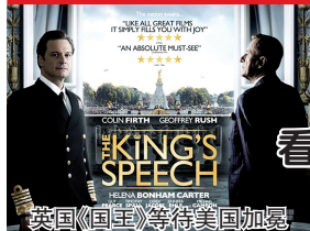
英国《国王》等待美国加冕