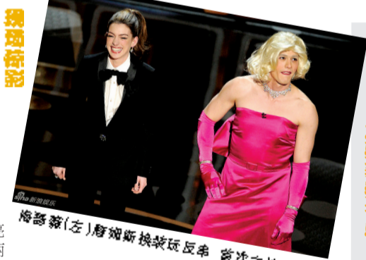
詹姆斯·弗朗哥(左)詹姆斯·弗朗哥玩反串 首次主持奥斯卡

日前,因一对斗鸡眼而闻名的德国负鼠海蒂预测英国男演员、电影《国王的演讲》男主角科林·费斯将获得最佳男主角奖,预测娜塔莉·波特曼将荣获最佳女主角奖。据悉,海蒂每天会被放在一排假的奥斯卡小金人旁边,每个小金人都贴有演员的头像。海蒂首先触碰的那个小金人就是它预测的该奖项得主,结果一切都让它猜对了。