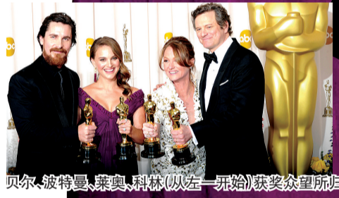
贝尔、波特曼、莱奥、科林(从左一开始)获奖众望所归

“对我来说,口吃就是个肌肉记忆过程。如果你做一件事足够频繁,你的身体会不由自主地这么做。表演时我提醒自己这不是真口吃,只是大脑在跟我开玩笑。”——英国人科林·费斯说,自己在拍摄《国王的演讲》时,并没有真正见过英国的皇室成员,他专门找了有些“口吃”的乔治六世的一些信件看,并找到了很多和皇室成员有过亲密关系的人交谈。