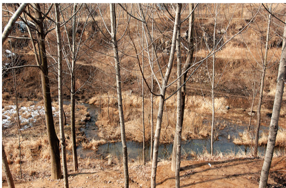
李家沟文化遗址旁,溱水河静静流淌。

“这是多年来治理的结果,因为上游搞起了旅游项目,不再让污水向河里排了。”同行的自然之友环保志愿者介绍。