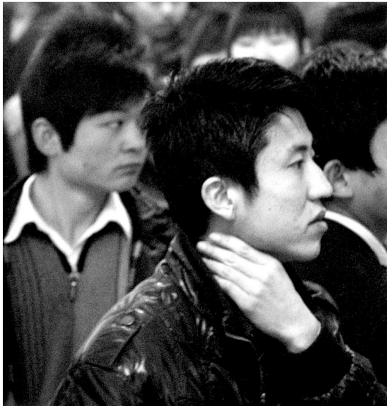
更多的求职者在询问和观望，宁波的老板们在热情介绍企业，并欢迎他们带朋友去参观。

郑州人才市场的张会香认为，本地企业有着“地主”的天然优势，但是并不能裹足不前，“我们接待外地组团来招工的越来越多，招工竞争正在加剧，本地的企业要重视形势，首先在利润许可的条件下尽量提高待遇，同时要加强与学校的合作，定向培养。”