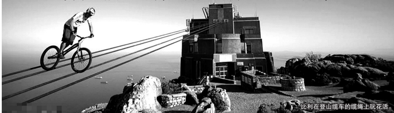
比利在登山缆车的缆绳上玩花活。