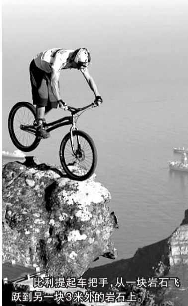
比利提起车把手,从一块岩石飞跃到另一块3米外的岩石上。

这些惊人的照片不是PS(PS是电脑修图软件photoshop的缩写)来的,28岁的比利时职业自行车手肯尼·比利确实做出生死一线间的冒险特技,他在南非开普敦桌山1048米的花岗岩悬崖上表演了自行车特技。