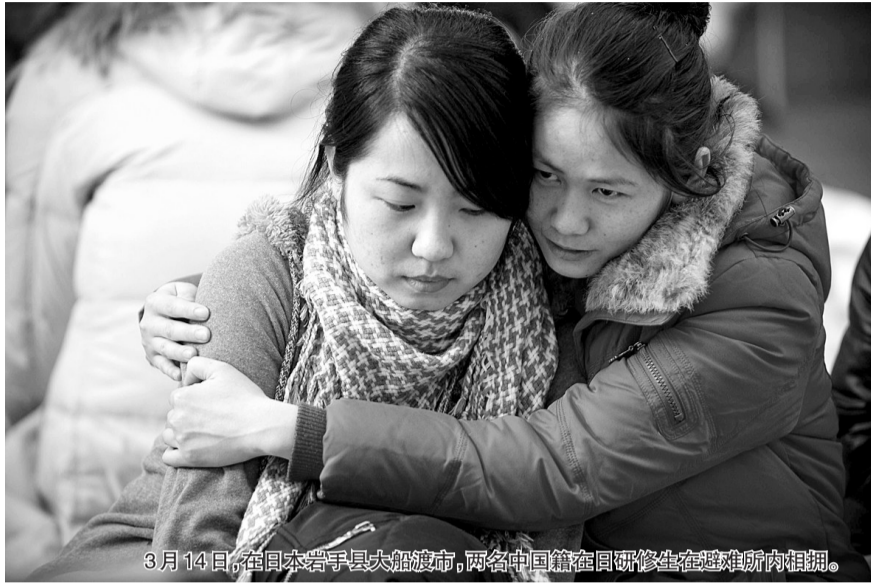
3月14日,在日本岩手县大船渡市,两名中国籍在日研修生在避难所内相拥。