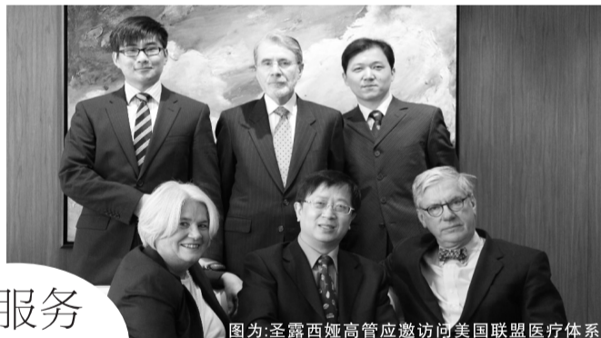
图为:圣露西娅高管应邀访问美国联盟医疗体系

那么,从现在起,您大可放宽心了。郑州圣露西娅商务信息咨询有限公司将竭诚为您提供最优质的服务。通过圣露西娅,您可以选择美国哈佛大学医学院最大的附属医院及其全球顶尖的医学专家为您服务。这些医学专家将为您评估健康风险、全面管理您的健康。您能够清楚了解自己的病情,从而选择最佳治疗方案。