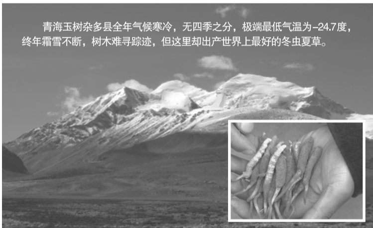
青海玉树杂多县全年气候寒冷，无四季之分，极端最低气温为-24.7度，终年霜雪不断，树木难寻踪迹，但这里却出产世界上最好的冬虫夏草。

真正的冬虫夏草主要生长在3000米海拔以上的森林草甸或草坪上，主要分布在四川、青海、西藏等地，其中青海玉树杂多县最为有名，被称作“中国冬虫夏草第一县”。这个唐古拉山北麓的高原区域，平均海拔4500米，碱性土壤中矿物质金属物质含量丰富，昼夜温差大，日照充足，加上适宜的空气湿度，使得这里出产的冬虫夏草色正、体满、营养价值高闻名于世界。自古就有“冬虫夏草出玉树，玉树虫草数杂多”的说法。每斤1000头的特优一级虫草，多数产自这里。