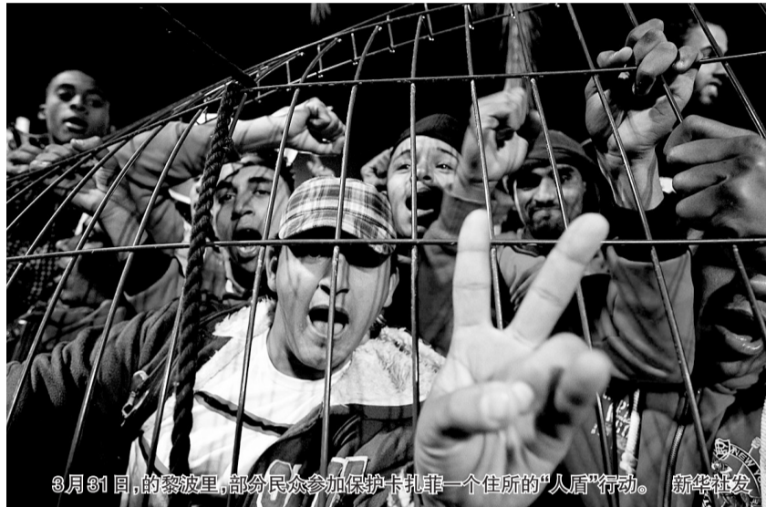
3月31日,的黎波里,部分民众参加保护卡扎菲一个住所的“人盾”行动。

美国国防部3月31日宣布,美国战机4月2日将结束空袭利比亚,希望北大西洋公约组织其他成员国填补“空缺”。