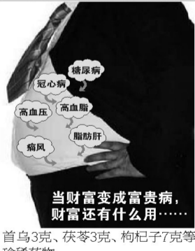
当财富变成富贵病,财富还有什么用……

特大优惠:买1赠1 订购 400-603-7199 优惠活动仅限3天 热线: 0371-66671762 活动地址: 亚细亚负一楼医药部二区/中原商贸城一楼医药部