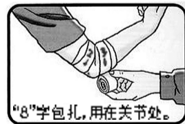
“8”字包扎,用在关节处。