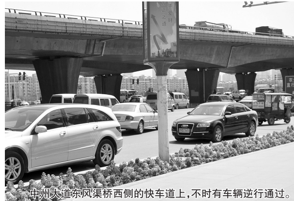
中州大道东风渠桥西侧的快车道上,不时有车辆逆行通过。 □晚报记者 张玉东 实习生 靳丽洋/文 晚报记者 周雨/图

大河网友程建勇1980说:中州大道右转弯东风路的辅道上,经常有从东风路逆向左转至东风东道,并且沿非机动车道或者机动车辅道逆向北行驶,希望有关部门能尽早安装摄像头。 昨天12点40分,记者在中州大道东风路西北角进行观察:由东向西、由西向东、由南向北不时有车辆逆向拐入东风路右转辅道上,使得并不宽敞的辅道变成了“临时”双车道,给正常行驶的车辆带来极大不便。 从12点40分至50分,共有7辆车逆行,其中还有一辆由西向北直接逆行拐入辅道的公交车。 一名过路司机说,如果到鑫苑路,按照正常的行驶线路,必须要绕道东风路经三路,而从辅道可以直接逆行穿过东风渠桥到达。 “我们已经治理好多回了,也罚了好多逆行驾驶员,可就是有些不自觉的驾驶员,为了省那一点路,明知是逆行还要闯。”交警五大队李警官说,现在在民警站那儿就没人闯了,但民警不可能24小时值班,还要依靠广大驾驶员遵章驾驶,才能从根本上治理逆行行为。 昨天下午,记者将网友建议在辅道路口装电子警察的想法,向市交警支队支队长热线进行了反映。