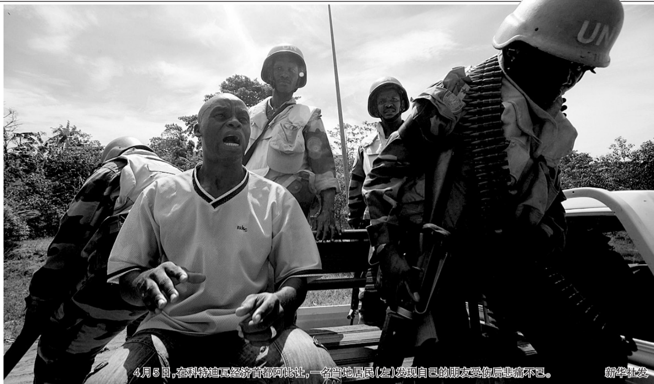
4月5日，在科特迪瓦经济首都阿比让，一名当地居民(左)发现自己的朋友受伤后悲痛不已。