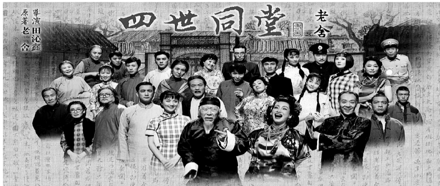
85万字巨著浓缩成2小时45分钟的话剧

85万字文学巨著浓缩成2小时45分钟的舞台艺术 郑州海选“小顺子”6~9岁小男孩可报名