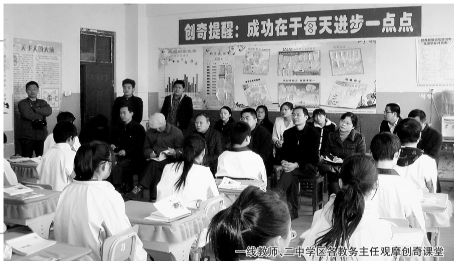
一线教师、二中学区各教务主任观摩创奇课堂