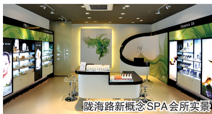
陇海路新概念SPA会所实景

性进行招聘, 主要是想为她们搭建一个展示自我的平台, 同时也希望她们能掌握一技之长, 抓住再创业的机会。”该公司总经理还表示。