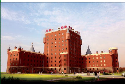
● 郑州动漫基地大楼

优先建设基础设施和公共服务设施 :创新融资手段,积极运作BT、BOT等模式,加快开元路西延至四环、文化路北延至黄河大堤、黄河南岸景观大道及长兴北路、西三环北延、新苑路、新龙路等道路建设,扩充东西连接主干道,打通南北融城大通道。将拉高城区公共服务体系的配建标准,通过“引进、培育、合作”三种模式,加快实现优质教育、医疗、养老资源的倍增。