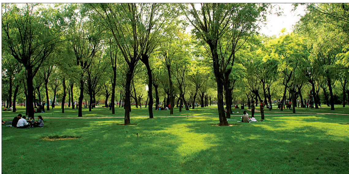
● 风景旖旎的古树参天公园

以北四环为中轴,南北两侧各1公里,介于黄河生态绿带与贾鲁河绿化廊道之间相对独立、以生态为特色的区域,规划面积72平方公里,规划人口20万。以该区域为核心和先导,坚持差异化发展理念,优先打造北四环高端服务业聚集带,彰显现代田园城区个性特色,实现高端服务业新城“一年打基础、三年出形象、五年大跨越”的目标。