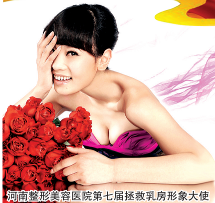
河南整形美容医院第七届拯救乳房形象大使

上个月,河南整形美容医院举办了“绽放吧,乳房”大型丰胸活动,共计约800多名女性实现丰满梦想。 晚报记者 董亚飞 实习生 朱张文