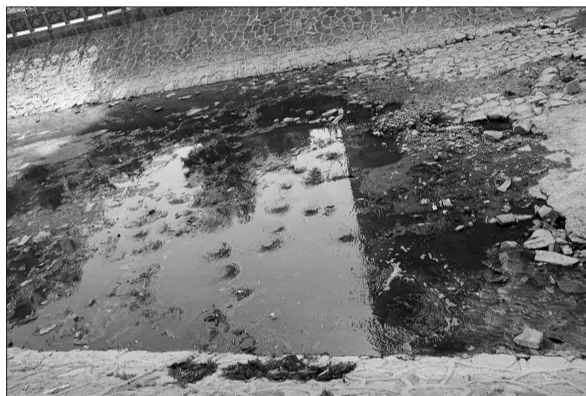
大学路到紫荆山路之间的河段