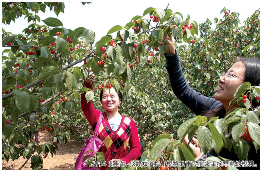
5月4日上午,少数知道梅山樱桃的市民前来采摘早熟的樱桃。