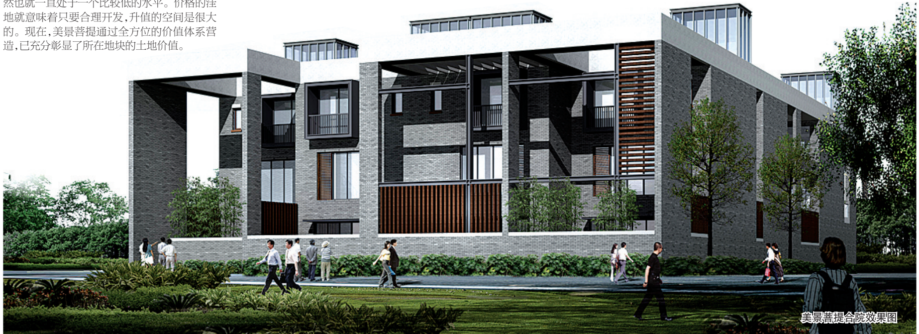
美景菩提合院效果图