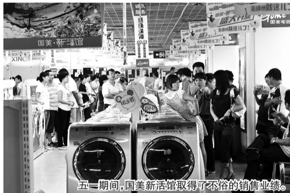
五一期间,国美新活馆取得了不俗的销售业绩。