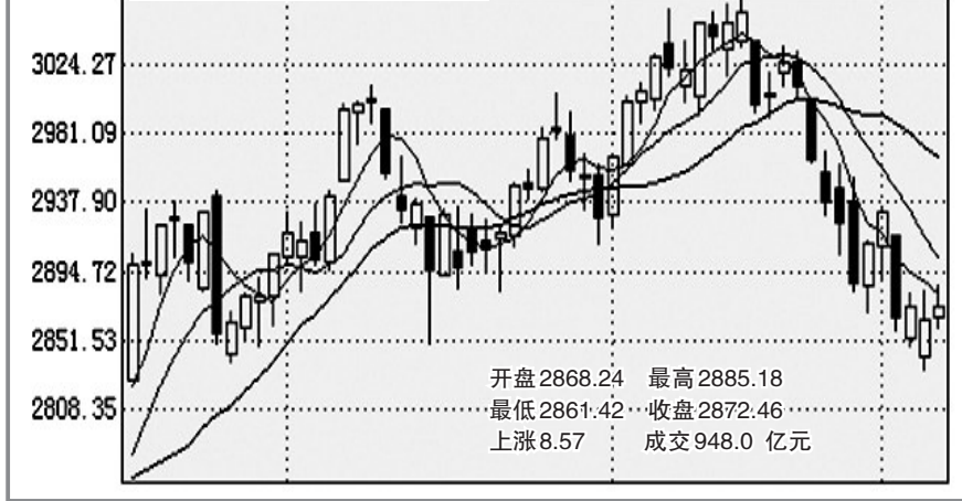
深成指 开盘12074.14 最高12214.18 最低12074.14 收盘12125.01 上涨57.40 成交631.3 亿元