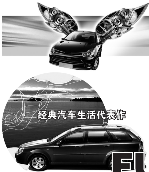
经典汽车生活代表作

生活方式：他们是70后80后的年轻人，他们旅行、自驾、开Party、玩转人生，他们青春未泯、梦想依存，他们追求家庭与事业的同步完美，更追求符合潮流又经济实用。 经典设计：这种生活方式需要能集轿车的舒适性和燃油经济性、MPV的大空间和多用途、城市SUV的动感外观和高安全性于一体并“宜商宜家”的车型，FUV(时尚多功能车)让这种生活成为现实。