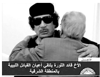
利比亚领导人卡扎菲会见部落首领。