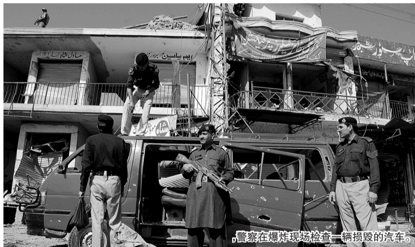
警察在爆炸现场检查一辆损毁的汽车。

2011年，郑州晚报发行量逆势飙升，创历史新高，发行市场占有率超越同城第三、第四平面媒体总和，成为省会报业市场主流媒体都市报。咨询电话：65837780 67655128