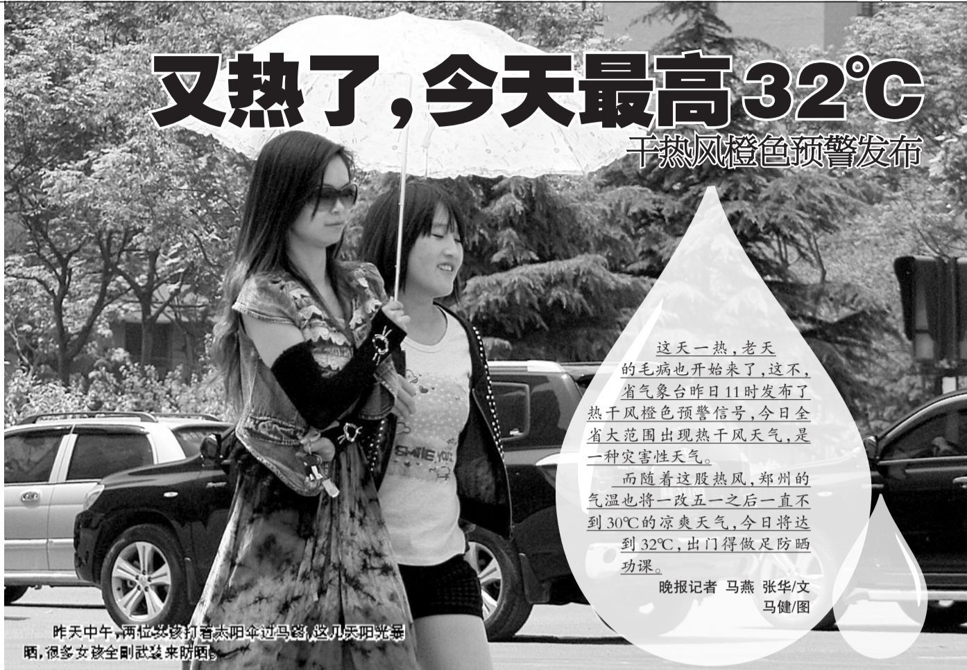
昨天中午,两位女孩打着太阳伞过马路,这几天阳光暴晒,很多女孩全副武装来防晒。

这天一热,老天的毛病也开始来了,这不,省气象台昨日11时发布了热干风橙色预警信号,今日全省大范围出现热干风天气,是一种灾害性天气。 而随着这股热风,郑州的气温也将一改五一之后一直不到30°C的凉爽天气,今日将达到32°C,出门得做足防晒功课。