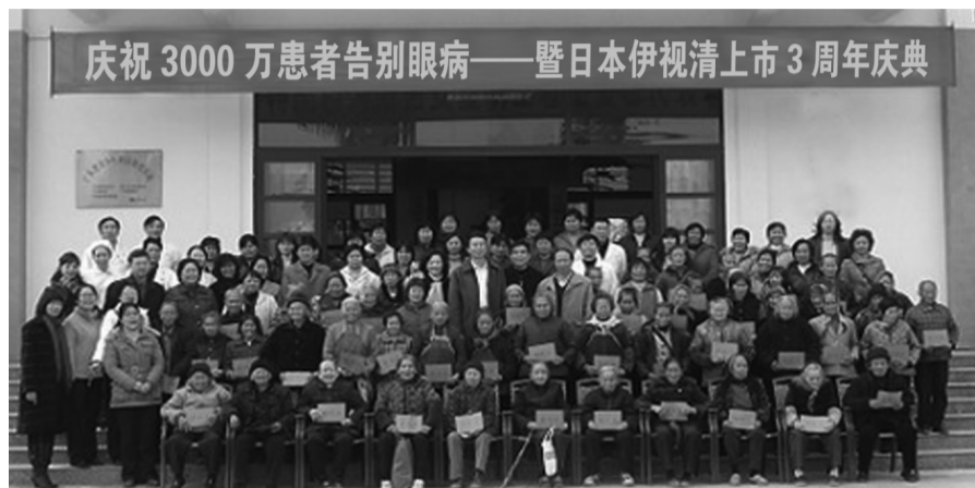
庆祝 3000 万患者告别眼病——暨日本伊视清上市 3 周年庆典

■3年，热销全国22省2万余药店热销，3000万眼病患者重见光明； ■3年，所有患者共计节约眼科医药费达千亿元，够二十余万家庭1年的生活费。 ■高新科技成果——伊视清，在中国创造了史无前例的眼病康复奇迹!