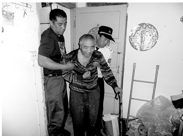
巡防队员把老人扶起来