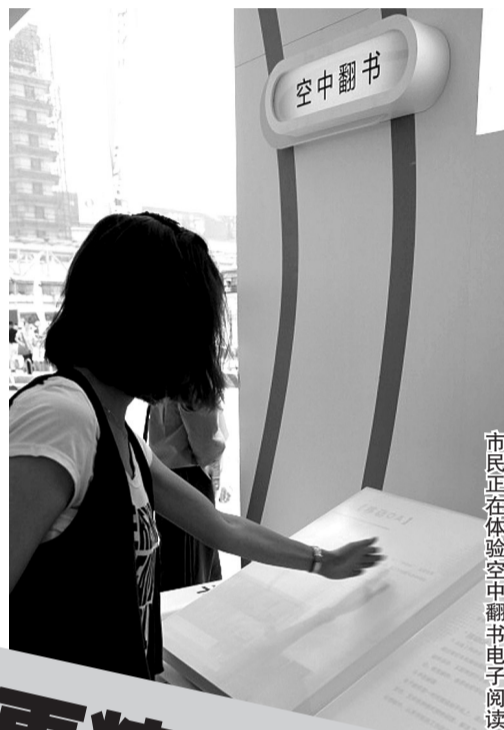
市民正在体验空中翻书电子阅读

郑州移动还向全市农村客户发放了1万份调查问卷，第一时间倾听农民需求，改善服务质量。