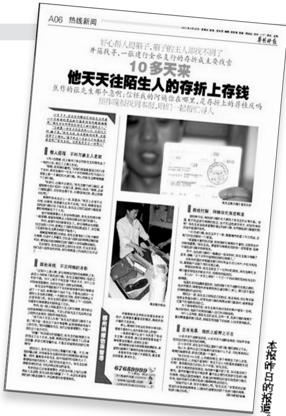
本报记者 王小明 报道

下午3点,建行郑州金水支行办公室张主任打来电话说,营业部查出了一个上海的电话,也许能找到蒋桂庆。“上午,看了晚报,大家都在讨论,感觉张先生实在太热心了,我们就想帮忙找找。”金水支行营业部的赵主任说,他们寻找的过程也不轻松。“蒋桂庆的存折是在2006年4月办的,由于开户时间比较早,没有留下任何联系方式。”赵主任说,他们试着查了查明细,发现今年5月6日,蒋桂庆在上海一个网点办过业务,留有一个固定电话号码。他们和上海网点沟通后,对方提供了这个电话号码。“你们试试能不能用,要真不行,咱们再一起想办法。”赵主任说。