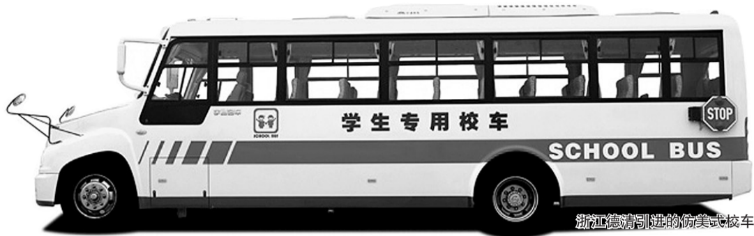
浙江德清引进的仿美式校车