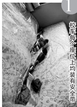
校车每个座位上均装有安全带

这些校车承担5000多名12周岁以下小学生的上下学接送任务，这个数字大约是德清全县小学生的一半，其中包括两所民工子弟学校。