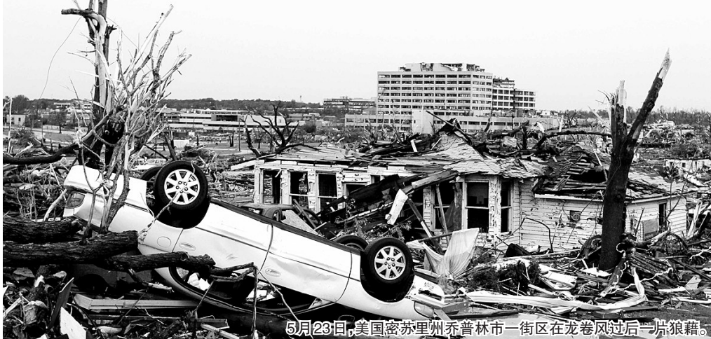
5月23日,美国密苏里州乔普林市一街区在龙卷风过后一片狼藉。

正前往爱尔兰访问的总统贝拉克·奥巴马在“空军1号”上发表声明说:“我们称赞那些在艰难时刻帮助朋友、邻居,参与救灾的英雄行为。”他向尼克松保证,联邦政府将为密苏里州提供一切所需帮助。目前,联邦紧急事务管理局工作人员已前往密苏里州处理救灾事宜,与当地政府共同开展救灾工作。 据新华社电