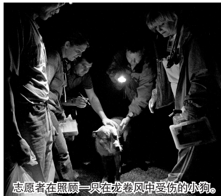
志愿者在照顾一只在龙卷风中受伤的小狗。

当地消防部门说,乔普林市两到三成的地方都遭到龙卷风袭击,包括学校、教堂以及民宅在内的2000多座房屋建筑被毁。龙卷风还破坏了当地电网和煤气管道,致使部分地区发生火灾,一些地方直至23日上午仍在燃烧,空气中混杂着天然气与灰烬的气味。