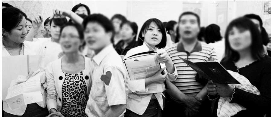
开盘两天吸引了上百名购房者选购

新芒果的质量方针“设计优先，过程从严，缺陷必究，诚信业主，追求满意”，就是把前期的产品策划设计放在第一位。6年光辉历程，以专注产品品质和至诚服务而发展成为业界中坚力量。而新芒果·和郡的劲销，便是新芒果房地产卓越品质的见证。