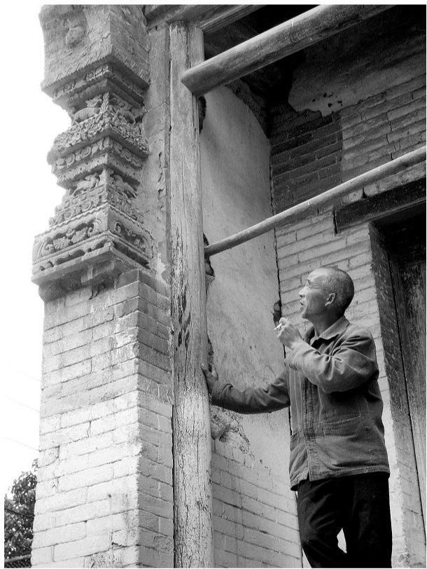
村民在看砖雕上的动物和花卉。