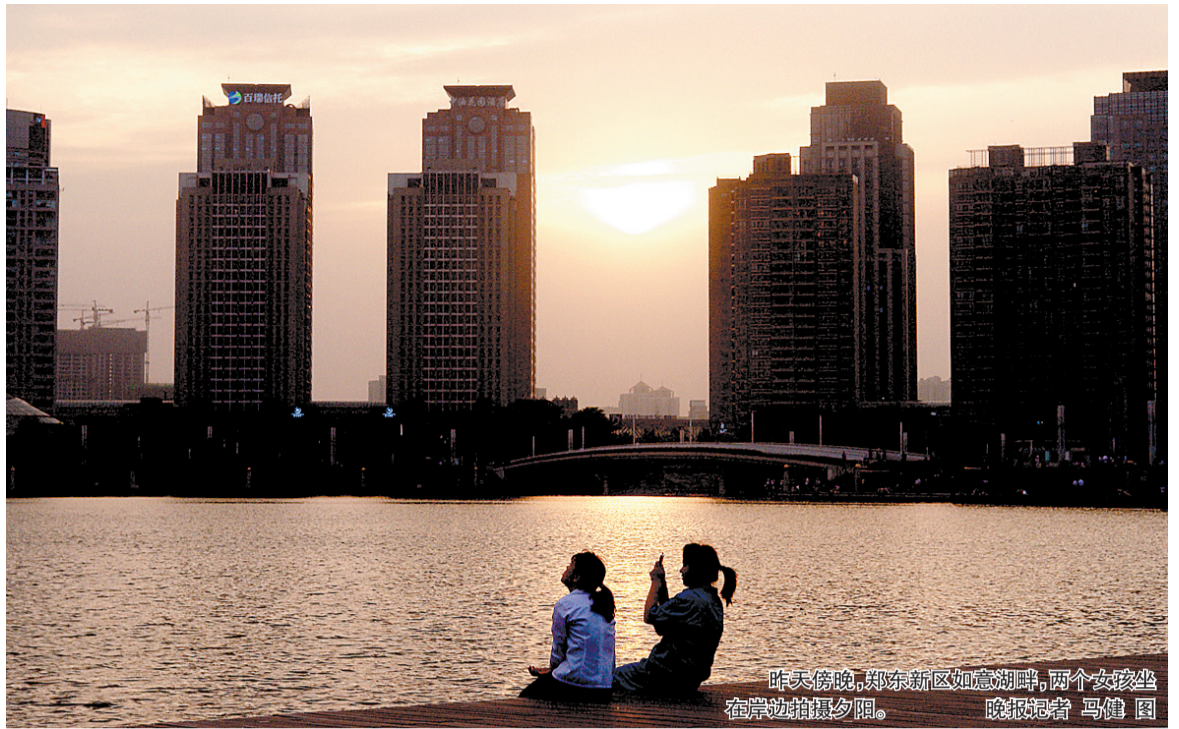
昨天傍晚,郑东新区如意湖畔,两个女孩坐在岸边拍摄夕照。

2011年6月8日 星期三 统筹 安学军 美编 任艳华 校对 李文 版式 李仙珠