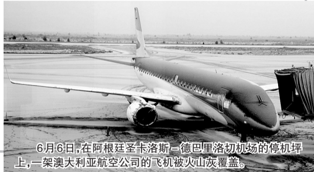
6月6日,在阿根廷圣卡洛斯-德巴里洛切机场的停机坪上,一架澳大利亚航空公司的飞机被火山灰覆盖。