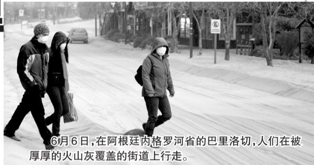
6月6日,在阿根廷内格罗河省的巴里洛切,人们在被厚厚的火山灰覆盖的街道上行走。

目前智利政府成立的专家小组正密切监视火山活动,每小时提供实时监测报告。河流大区政府称,至少到目前为止已排除喷发岩浆的可能,另据专家数据分析,普耶韦火山群戈登喷发口的岩浆流速慢、黏性强,即便喷发居民也有充足的时间转移,因此不必过度担心。 据新华社电