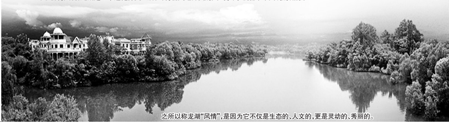
之所以称龙湖“风情”，是因为它不仅是生态的、人文的，更是灵动的、秀丽的。