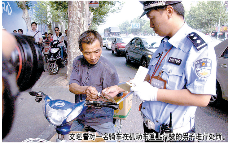
交巡警对一名骑车在机动车道上行驶的男子进行处罚。