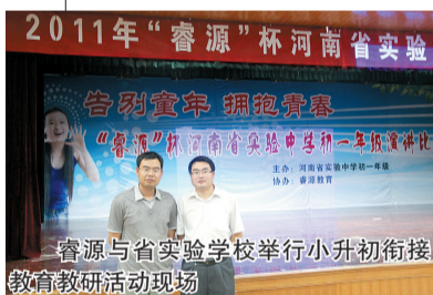
睿源与省实验学校举行小升初衔接教育教研活动现场