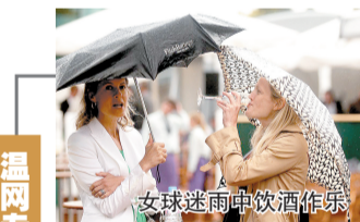
女球迷雨中饮酒作乐

李娜在网球路上越走越顺,但1996年,父亲因先天性血管狭窄去世,这是巨大的打击。父亲的去世让李娜一夜长大。李盛鹏病重期间,家里找亲戚朋友借了3万元钱。李艳萍回忆说:“当时我们单位效益不好,看病全部是自己垫付,我们只能四处借钱,只要借得到的都去借。后来她爸爸没治好,医生说这个病也不好治,当时医学不发达,这种病在中国蛮罕见的。当时李娜告诉我,‘妈妈,你不着急,以后我来还。’最后真的是靠李娜挣工资、奖金,把这笔钱还完了。”李娜从1996年12月开始参加工作、领工资,她随后一直把工资卡交给李艳萍保管。