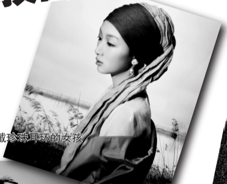
周冬雨——戴珍珠耳环的女孩