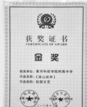
由附中师生创作、拍摄的电视剧获得全国金奖