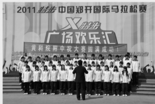
在郑开马拉松比赛现场演出

凡报考我校的应届初中毕业生,根据自己的爱好,可于即日起报名,凭测试证参加广播电视编导、播音与主持、影视表演、美术、音乐、舞蹈、器乐、体育的专题讲座与培训,由专家进行艺术特长的引领,为你选择更宽广的升学之路。